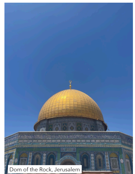
Dom of the Rock, Jerusalem